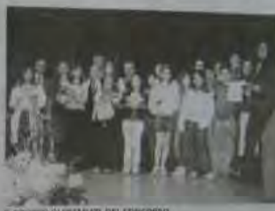
IL GRUPPO DI PREMIATI DEL CONCORSO