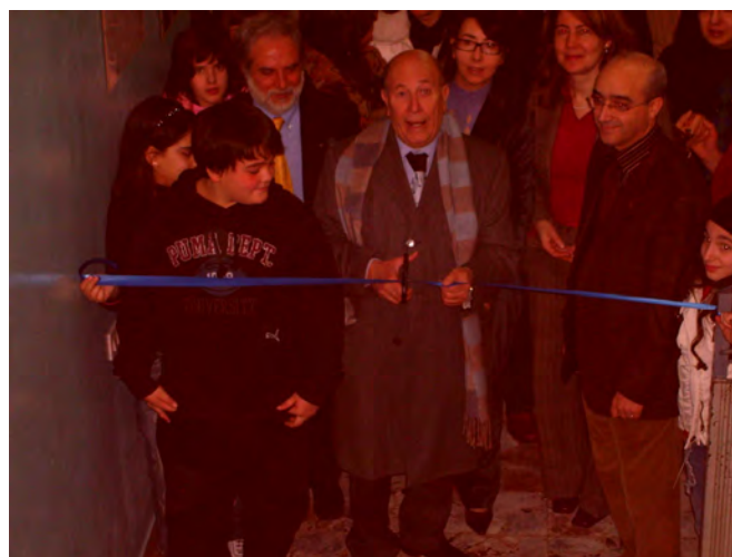
L'inaugurazione della manifestazione con il sindaco e i dirigenti scolastici.