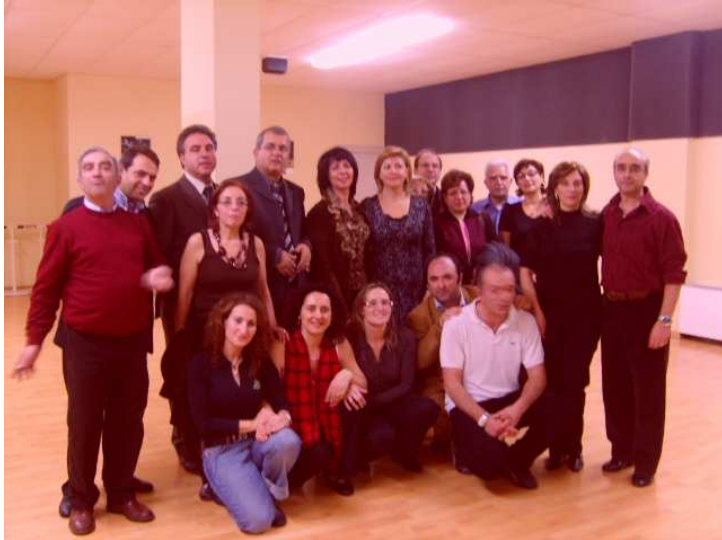
Foto di gruppo dei partecipanti al corso di ballo. Sotto la conviviale successiva alla proiezione di un film