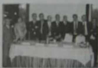
I ROTARIANI AL TAVOLO DELLA CHARTER