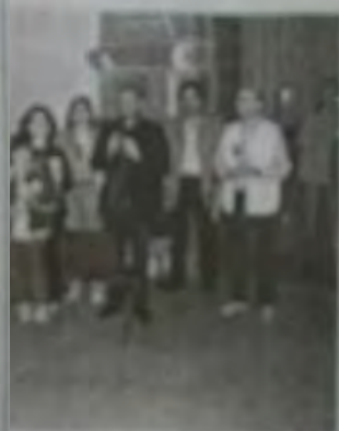
TRIO LA MAFIA