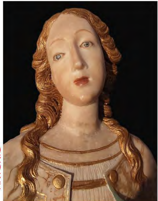
Annunziata di Bronte ( 1543)