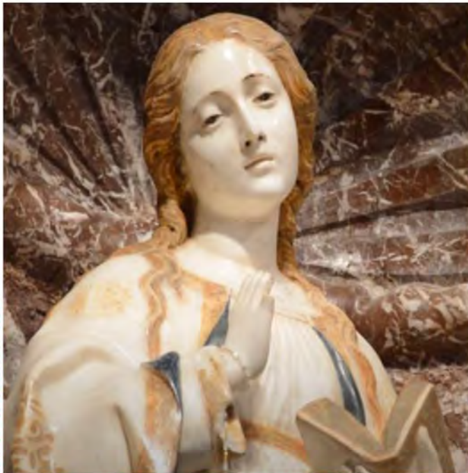
Annunziata di Rocca di Capri Leone ( 1533)