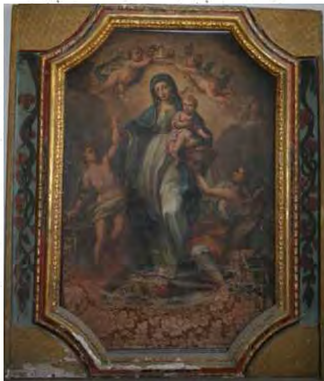
Il quadro prima del rstauro