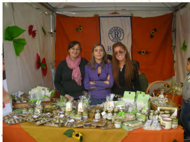
Raccolta fondi durante "la sagra del pistacchio"

ganizzato una passeggiata ai piedi dell'Etna, al piano dei Grilli, e in quell'occasione abbiamo anche partecipato al progetto Terrarium, progetto per la ricostruzione di Giampileri.