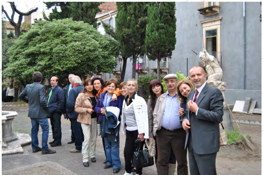
Foto di gruppo all'interno del giardino Mancanelli