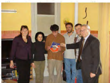
I ragazzi della casa famiglia