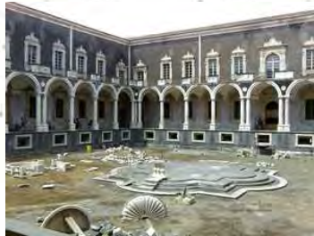
Convento dei Benedettini