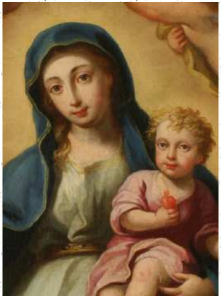
Un particolare del quadro

do, grazie all'opera del Padri gesuiti e dai tanti fedeli devoti. Il 6 febbraio 1738 con un breve atto apostolico Papa Clemente XII autorizzò il Culto a Maria SS. del Lume, stabilì la data della festa nella seconda domenica di settembre e concesse indul-