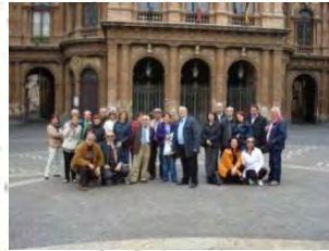
Piazza Teatro Massimo-