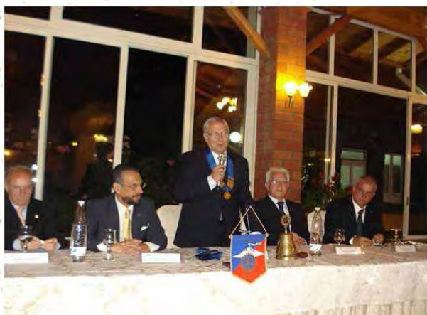
Il presidente Romeo durante il suo discorso

Il progetto "Emergenze sanitarie e primo soccorso per gli adolescenti" intende sensibilizzare i giovani alla conoscenza ed l'importanza del primo soccorso.