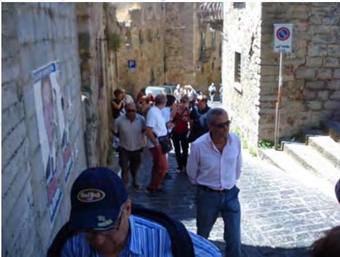
In giro con gli amici di Nicosia

lò e S. Maria) e creano due fazioni in continuo contrasto tra loro.