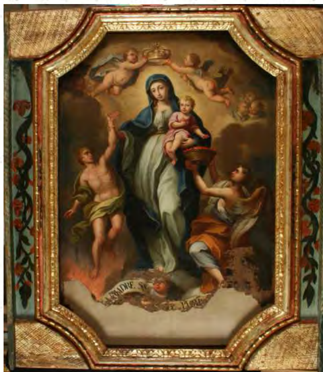
Il quadro dopo il rstauro