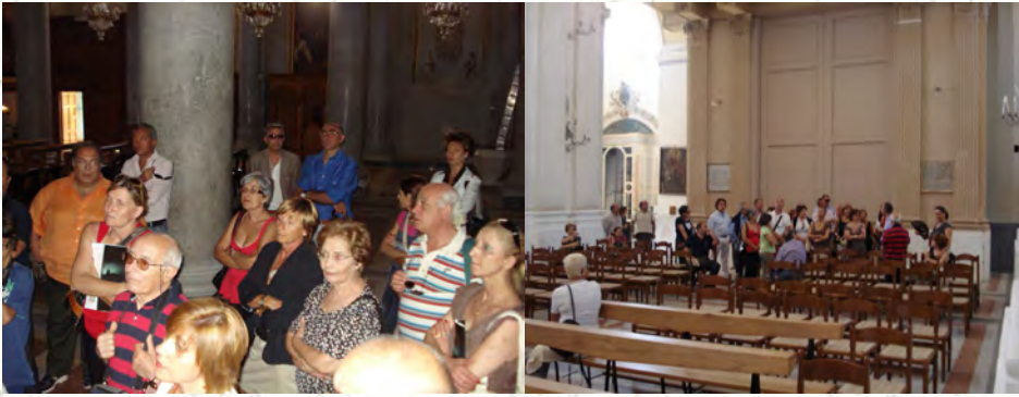
Visita delle Chiese di San Nicola e S. Maria Maggiore