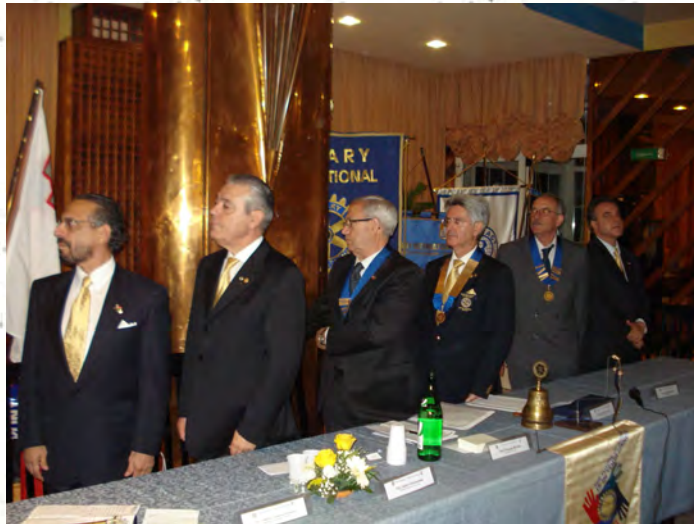
Onore alle Bandiere