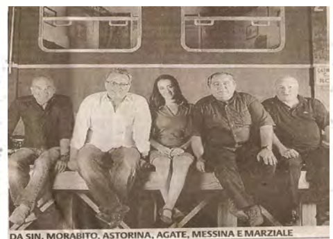
DA SIN. MORABITO, ASTORINA, AGATE, MESSINA E MARZIALE