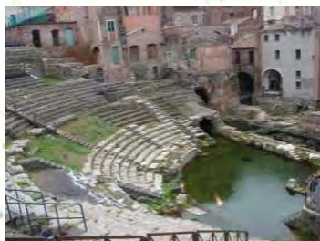
Teatro Antico Odeon