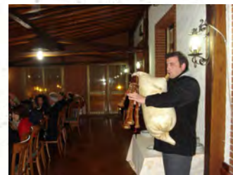
" Il Ciaramillaro"