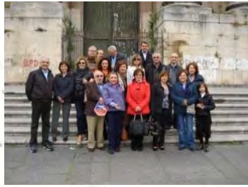
Foto di gruppo

Prima tappa, la visita al monastero di San Nicolò l'Arena, una costruzione, che, anche se incompleta, è per grandezza la seconda al mondo. Per le sue ricchezze, per gli stretti legami con la nobiltà catanese, ma anche per la sua attività culturale, ebbe un ruolo rilevante, soprattutto nel '700. I monaci vi abitarono sino al 1866; tre anni dopo esso venne asse-