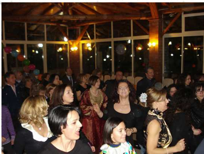
Alcuni momenti della serata