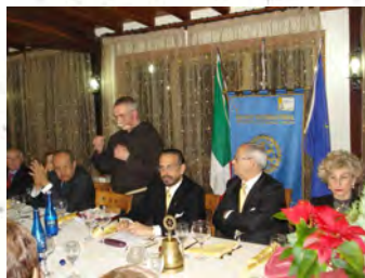
Alcuni momenti della serata