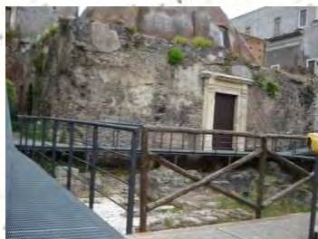
Terme della Rotonda