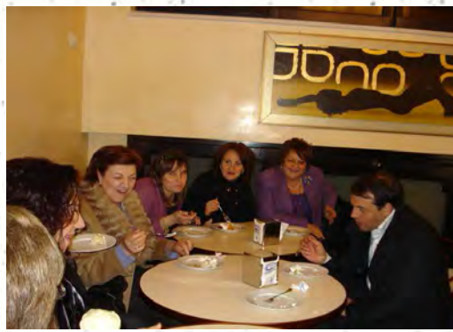
I soci durante la cena di San Giuseppe e mentre degustano un dolce alla caffetteria